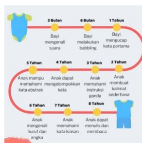
Gambar 1. Perkembangan Bahasa Anak

Gambar perkembangan bahasa anak usia dini menunjukkan bahwa kemampuan bahasa berkembang secara bertahap sesuai usia anak. Perkembangan tersebut dimulai sejak bayi mampu mengenali suara, kemudian berkembang menjadi kemampuan mengucapkan kata, memahami instruksi, hingga membaca dan menulis pada usia sekolah. Tahapan perkembangan bahasa ini dipengaruhi oleh stimulasi, interaksi sosial, serta lingkungan keluarga yang menjadi tempat pertama anak belajar berkomunikasi. Oleh karena itu, setiap tahap perkembangan bahasa anak perlu mendapatkan perhatian dan dukungan dari orang tua agar kemampuan komunikasi anak dapat berkembang secara optimal.