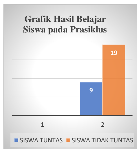
Gambar 1. Grafik Hasil Belajar Siswa pada Prasiklus

Pada siklus satu, terjadi peningkatan hasil belajar. Pencapaian ketuntasan belajar sebesar 57%, dengan nilai tertinggi 100, nilai terendah 60, dan nilai rerata 74,64. Untuk mempermudah dalam memahami hasil pelaksanaan pada siklus ini, maka berikut ini kami sajikan Grafik hasil belajar pada siklus I sebagai berikut: